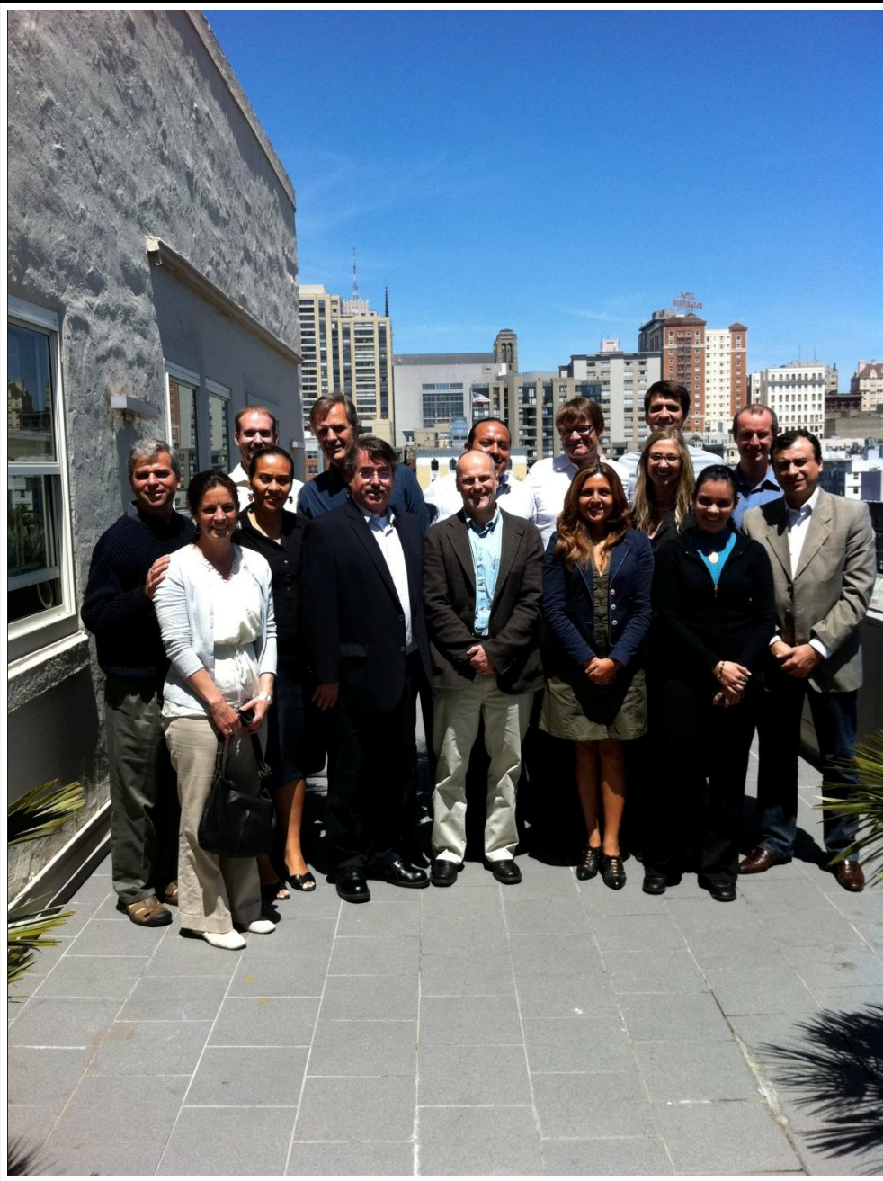
Grupo do ROW (15 pessoas entre técnicos e representantes governamentais)