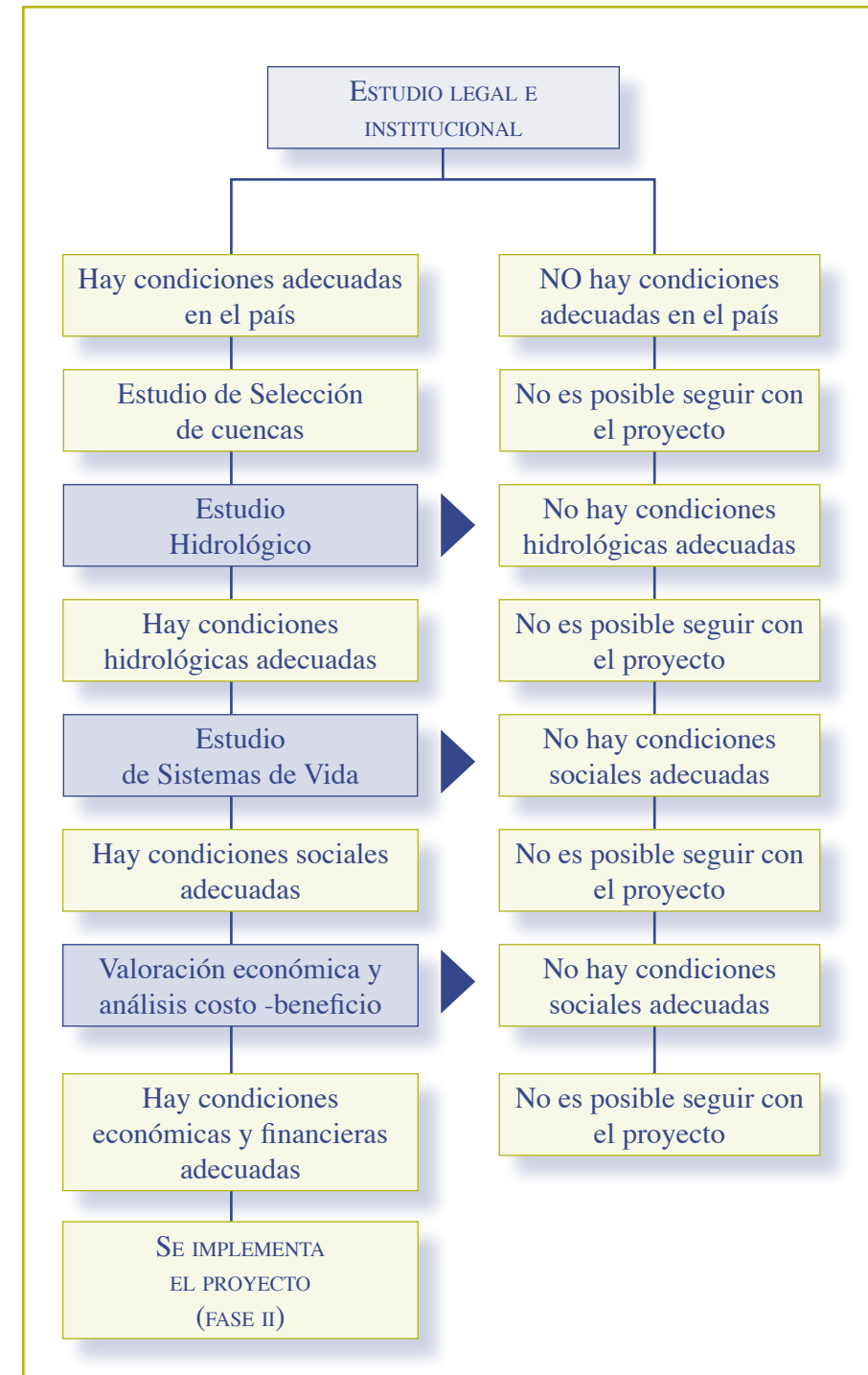
Figura 1. Secuencia de la Fase I del proyecto.

3. Estudio Hidrológico: permite identificar el problema central que afecta a los usuarios de cuenca baja, es una revisión de los servicios hidrológicos potencialmente requeridos y por los cuales se pagará.