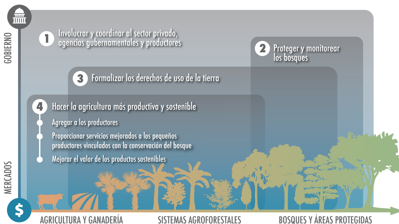
Figura 1. Elementos del Enfoque Protección-Producción

La Figura 1 muestra estos elementos y cómo los mismos simultáneamente requieren la participación del sector público y privado, en diversos grados, y la forma cómo se despliegan en un espectro de áreas agrícolas, agro-forestales y bosques a través del paisaje. Estos elementos se complementan para lograr los objetivos generales del EPP: conservación del bosque y mejoramiento de los medios de vida de los pequeños productores.