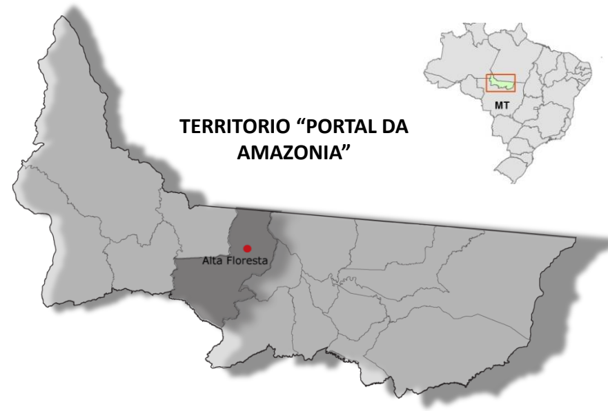
TERRITÓRIO "PORTAL DA AMAZONIA"