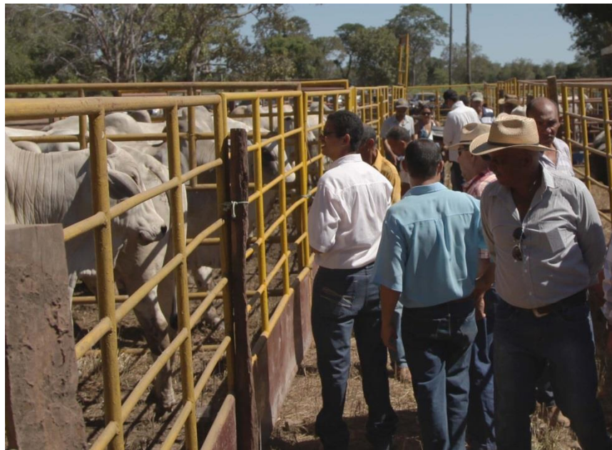
Primeira Feira Pró-Genética do Estado do Mato Grosso