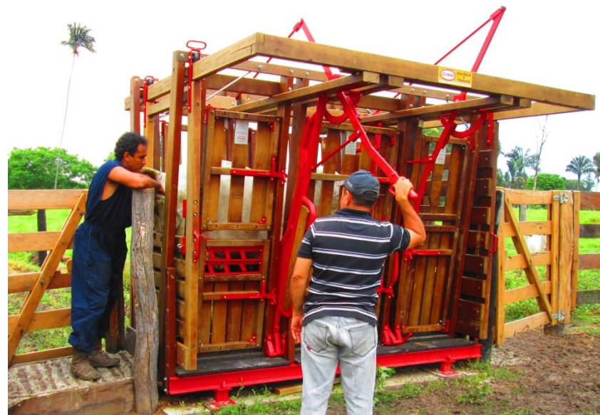
Infra-estrutura cedida para o Assentamento Mata Azul