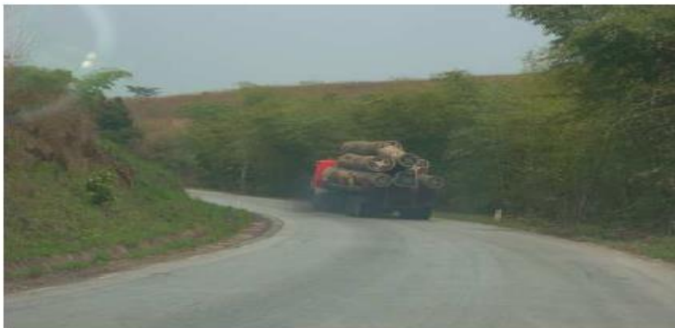
Le Parlement européen a adopté, le 7 juillet, un règlement imposant aux entreprises de prouver l'origine de leur récolte de bois pour lutter contre l'illégalité

Si un diagnostic cernant avec précision l'ampleur du phénomène est, par nature, impossible, les estimations les plus solides affirment cependant que de 20 % à 40 % du commerce mondial du bois serait d'origine illégale. Selon la Banque mondiale, ce trafic priverait les pays qui en sont victimes d'environ 10 milliards d'euros de