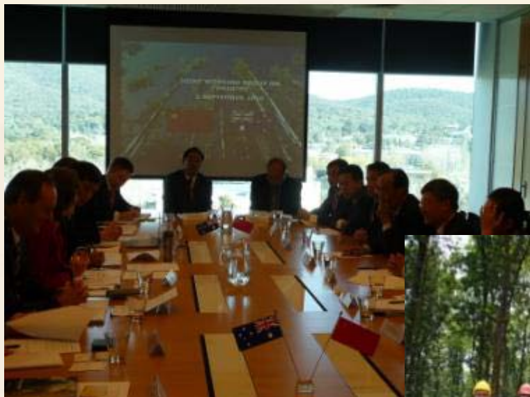
中澳打击非法采伐工作组会议