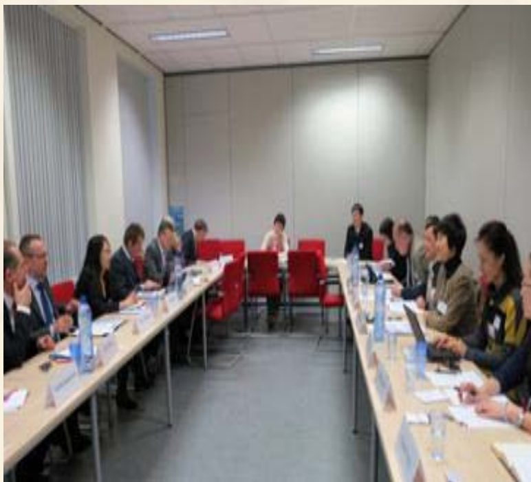
中欧森林执法和行政管理双边 协调机制（BCM）第4次会议

理顺了中欧森林执法与行政管理双边协调机制，推进政府、研究机构、产业协会、企业等在政策研讨、能力建设、信息交流、实地考察等方面的合作，促进中国利益相关者和对FLEGT VPA和欧盟木材法案的理解和经验分享。