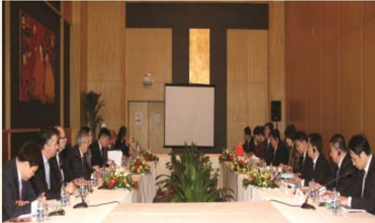
中美第4、5次双边论坛会议