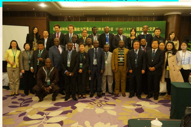
FLEGT VPA国家 经验交流会 (6个VPA国家)