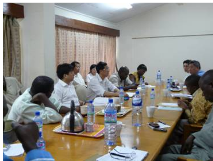
与加纳民间组织的座谈会