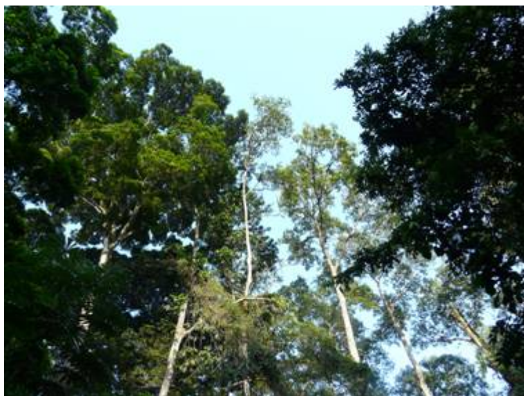
加蓬具有丰富的森林资源