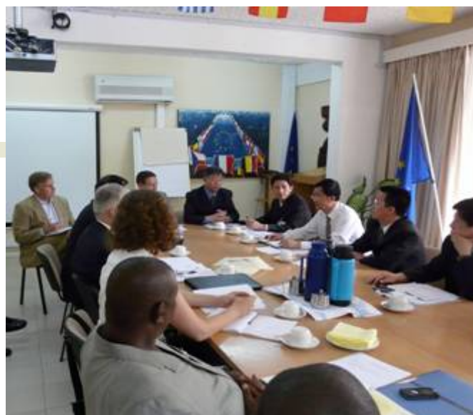
与驻加纳的国际机构会面