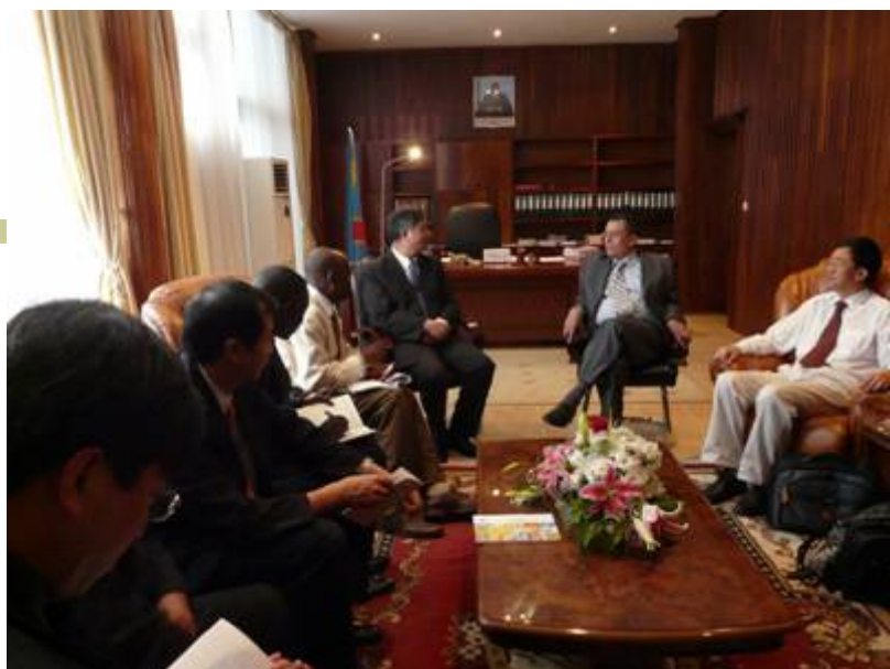
与刚果金环境部长会面